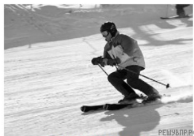
2 – лыжный спуск