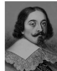
Абель Тасман РЕШУ ВПР.РФ

Подпишите на карте океаны, омывающие берега указанного выше материка.