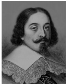
Абель Тасман РЕШУВПР.РФ

Подпишите на карте океаны, омывающие берега указанного выше материка.