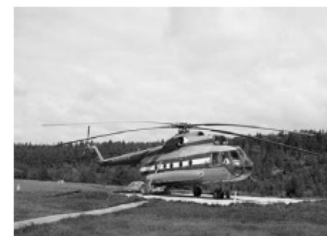
1 – вертолётная площадка

Какой из изображённых на фотографиях объектов может быть сооружён на территории, по которой проходит маршрут А–В? Запишите в ответе номер фотографии. Обоснуйте свой ответ.