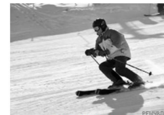
2 – лыжный спуск