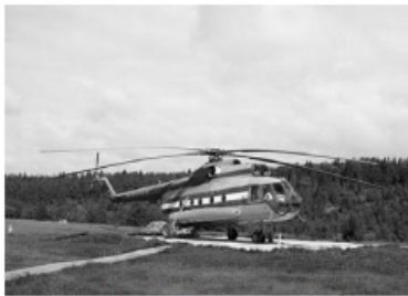
1 – вертолётная площадка

Какой из изображённых на фотографиях объектов может быть сооружён на территории, по которой проходит маршрут А–В? Запишите в ответе номер фотографии. Обоснуйте свой ответ.