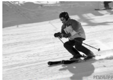
2 – лыжный спуск