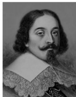
Абель Тасман РЕШУВПР.РФ

Подпишите на карте океаны, омывающие берега указанного выше материка.