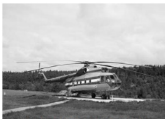
1 – вертолётная площадка

Какой из изображённых на фотографиях объектов может быть сооружён на территории, по которой проходит маршрут А–В? Запишите в ответе номер фотографии. Обоснуйте свой ответ.