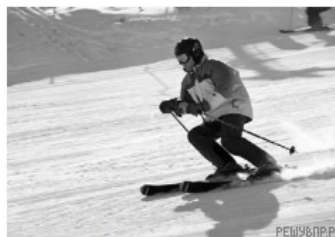
2 – лыжный спуск